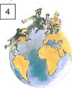
4 Deutschland als Weltmacht