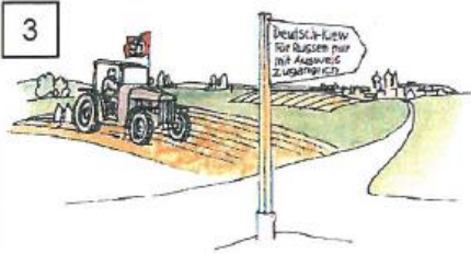
3 Raumgewinn im Osten