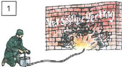
1 Weg mit Versailles

Lies im Buch DGZG die Seiten 127/128. Ergänze die Beschreibungen zu den Bildern.