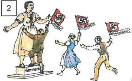
2 Alle Deutschen heim ins Reich